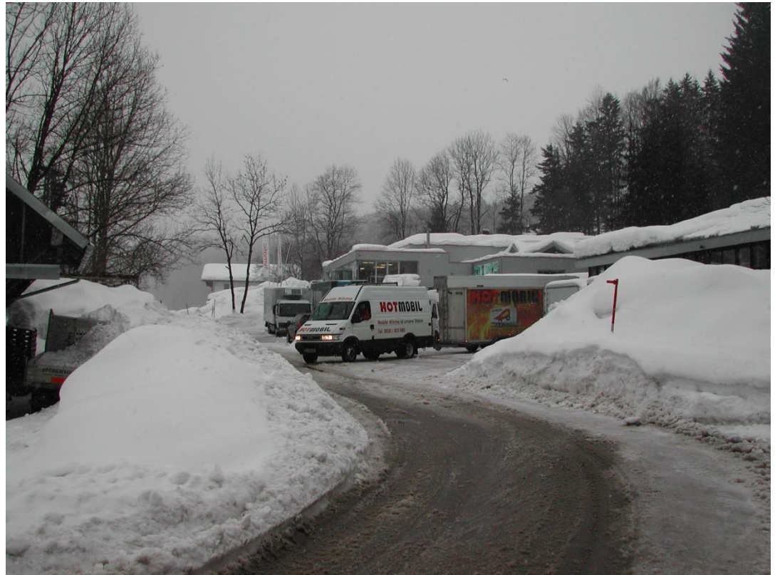
Anruf um 7:00